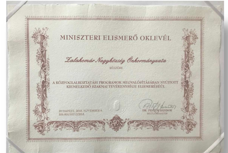
Dr. Pintér Sándor Belügyminiszter elismerő oklevele