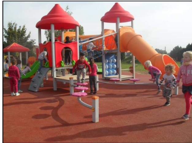
Gyerekek a birtokba vett játszótéren

A Zalacomári Napközöttthonos Óvoda játszótérének bővítési munkálatait szeptember első napjaiban kezdte el a kivitelező. A gyermekek figyelemmel kísérhették az udvar elkerített részén zajló munkafolyamatokat: alap kiásása, betonozási munkák, játékelemek összeszerelése és telepítése, ütésálló burkolat kialakítása, árnyékoló napvitorla felhelyezése. Nap, mint nap sóvárogva tették fel a kérdést: „Mikor lesz már kész?”